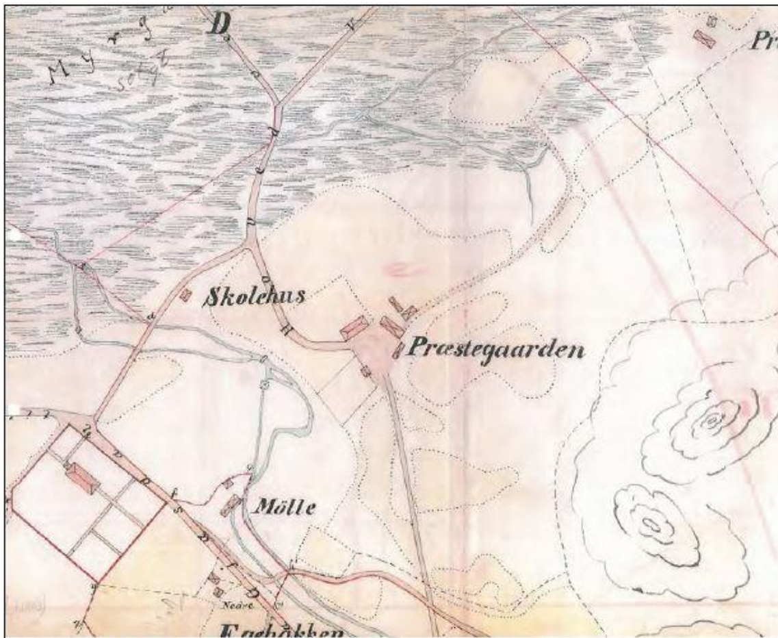
illustrasjon 10, Kart datert 1887