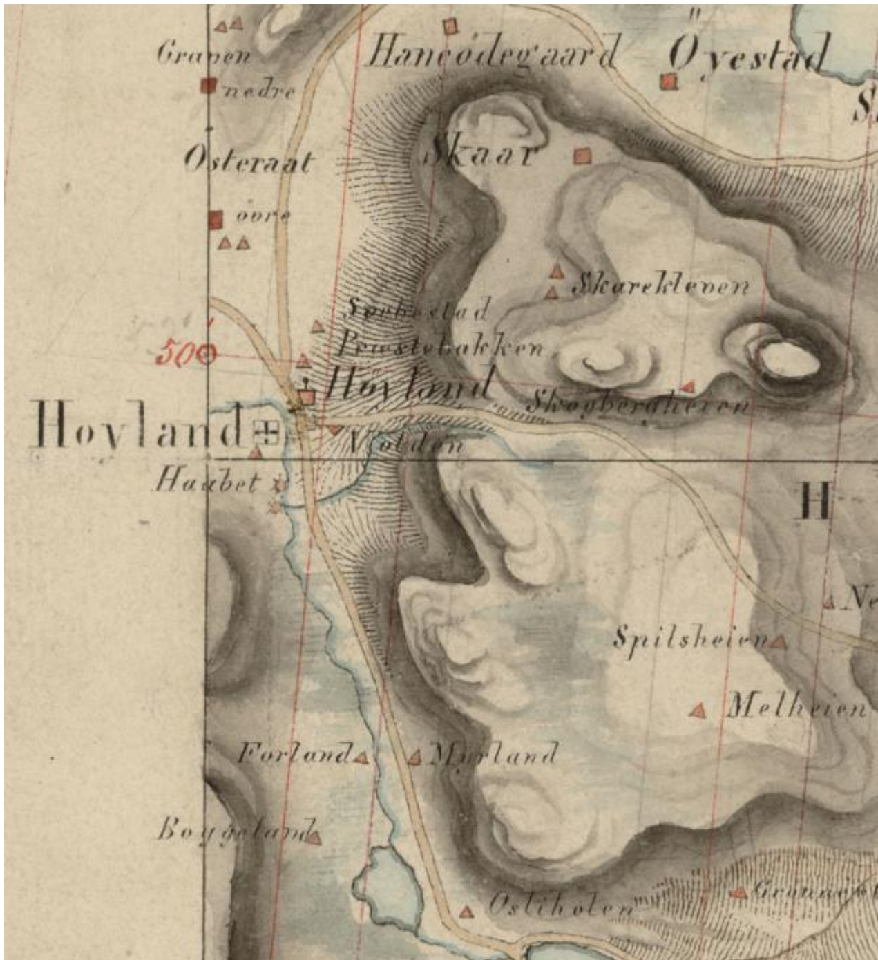
Originalkart fra 1855. Det er før drenering av dalbunnen. Veien gjennom dalen kalles «Den gamle Postvei» og går oppom tunet på Høyland prestegård. Kirkeveien går nordover, Prestegårdsveien svinger vestover. (Statens kartverk: rektangelht50_6b-5_1855 og rektangelht50_6b-7_1855).

I dag er Kyrkjevegen og Prestegårdsveien to av de gamle ferdselsveiene rundt sentrum av Sandnes som, siden de er lite modernisert i senere år, best har bevart en eldre karakter – dels med steingarder og kantrær. Disse veistrekningene har fortsatt kontakt med et kulturlandskap preget av jordbruk og gammel jordbruksbebyggelse. Brustedet ligger også i nær kontakt med det verneverdige miljøet Høyland kirkested. Det viktigste kulturvern hensynet blir å ta vare på elva med murene og den gamle veiens karakter.