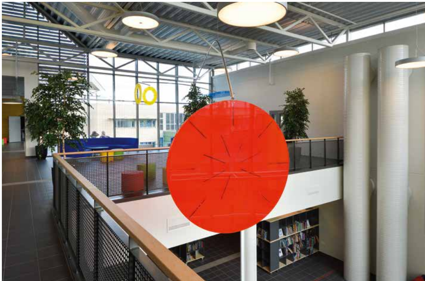
Sørbø skole, Dagen i dag (2015), © Marit Aanestad / BONO 2017