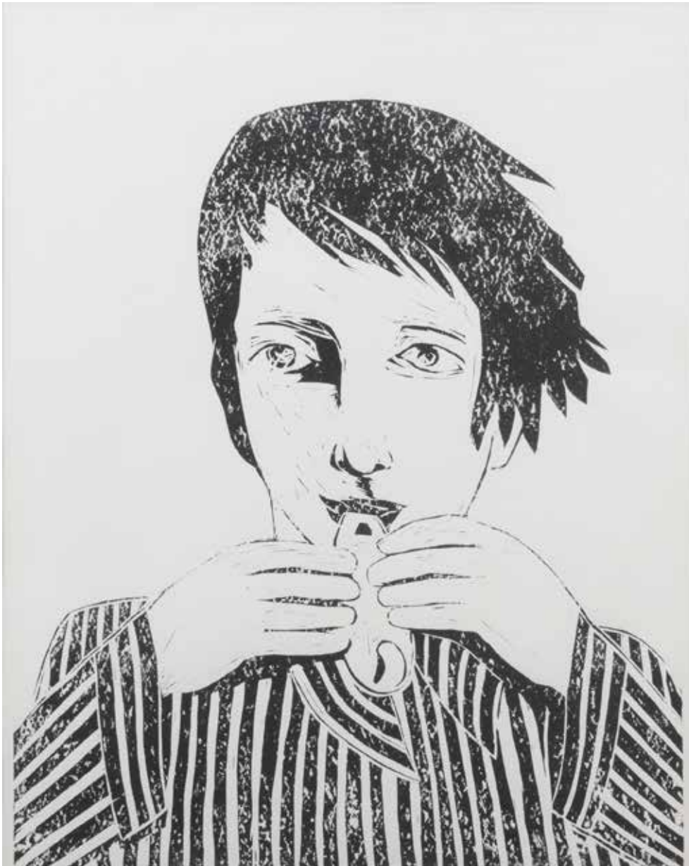
Plassert i flere bygg i Sandnes kommune, Sandnesgauken (1976), © Kjell Pahr Iversen / Bono 2017