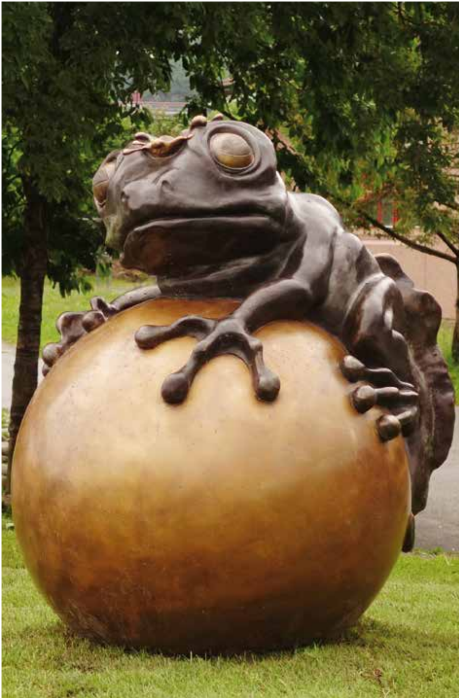
Iglemyr skole, Floskekongen – vil du holda me meg? (2016), © Laila Kongevold / BONO 2017