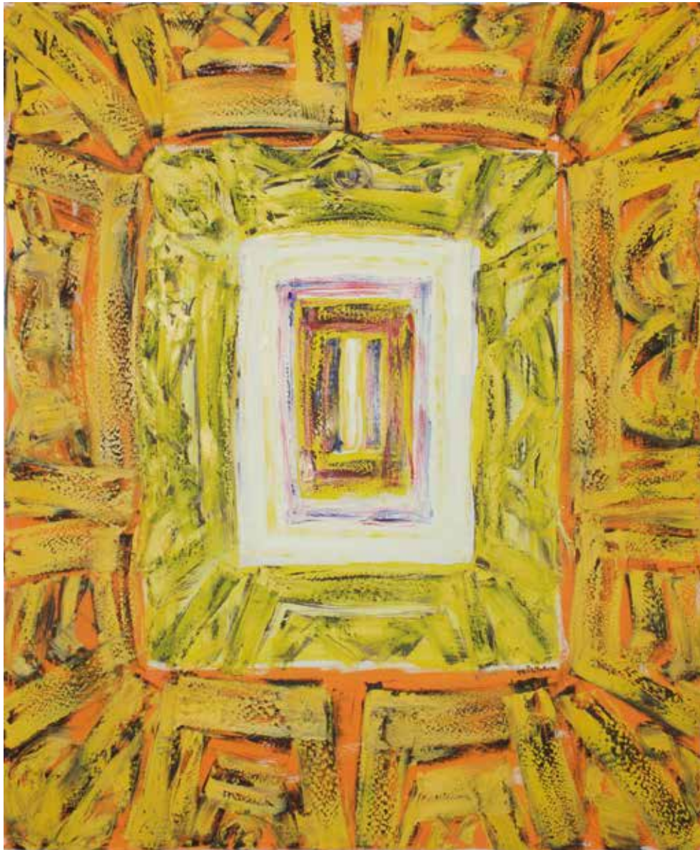
Rådhuset, IKON 10 (2010), © Kjell Pahr Iversen / Bono 2017