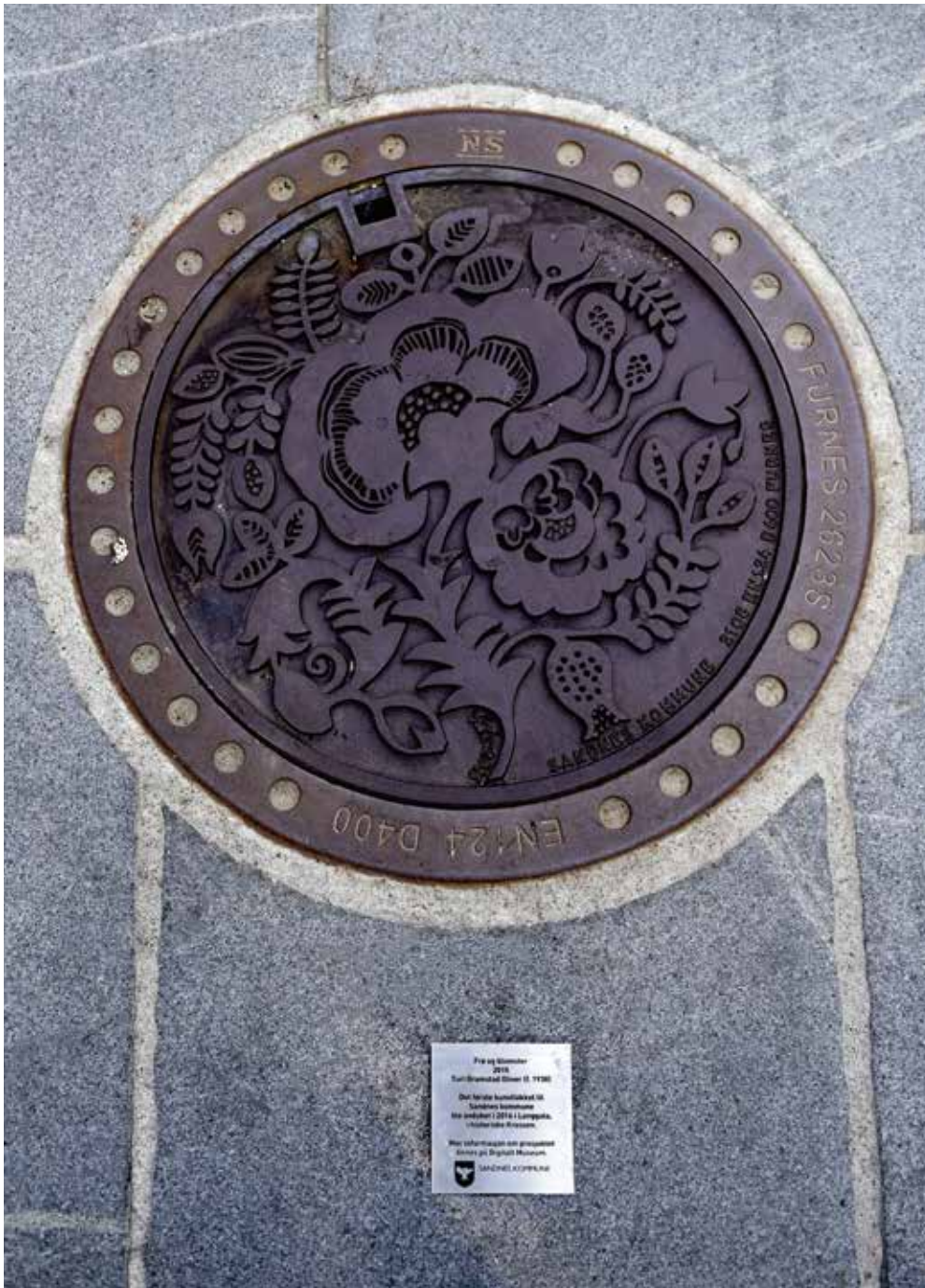
Kumlokk i sentrum av Sandnes, (2016), © Turid Gramstad Oliver / BONO 2017