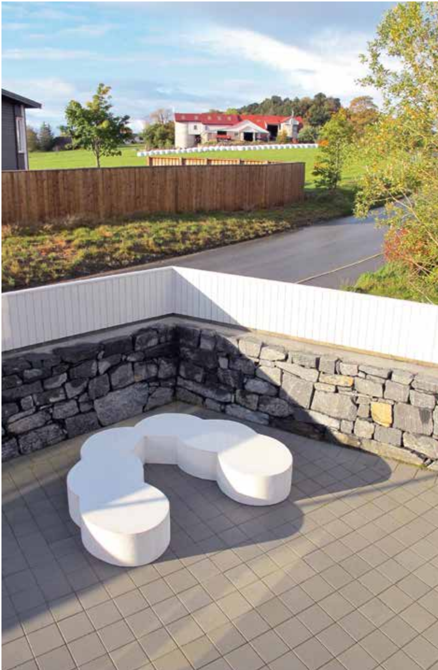
Kyrkjevegen Bokollektiv, Luft (2013), © Solveig Landa /Bono 2017