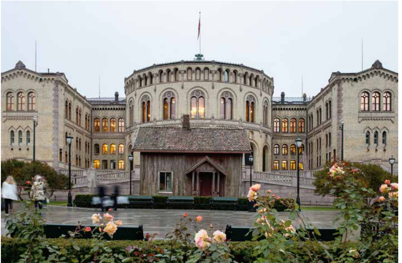
Stortinget, House of Commons (2015), © Marianne Heske /BONO 2017