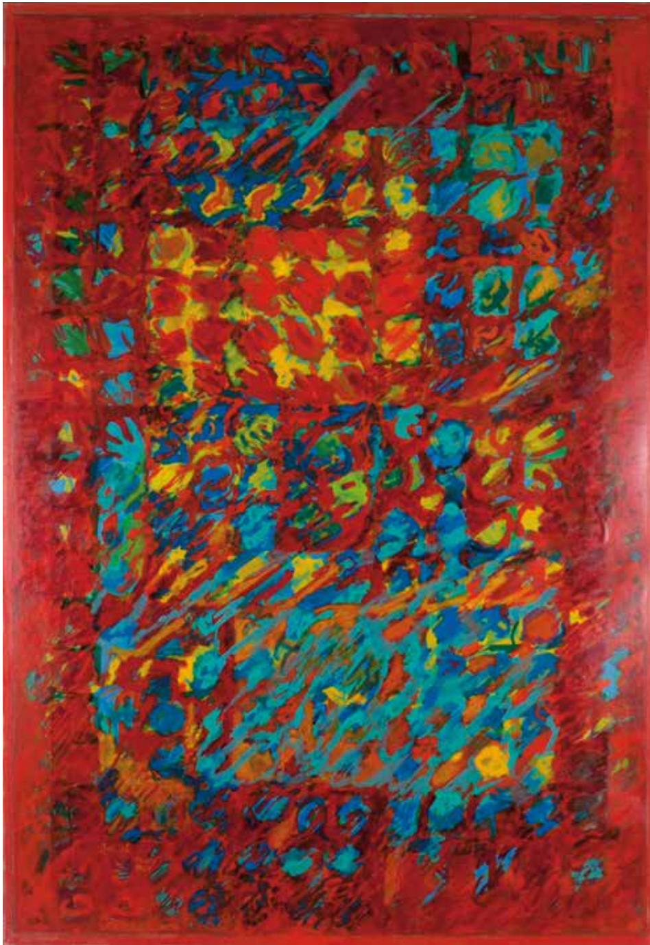
Kulturavdelingen, Uten tittel (1989), Ibrahim Jalal