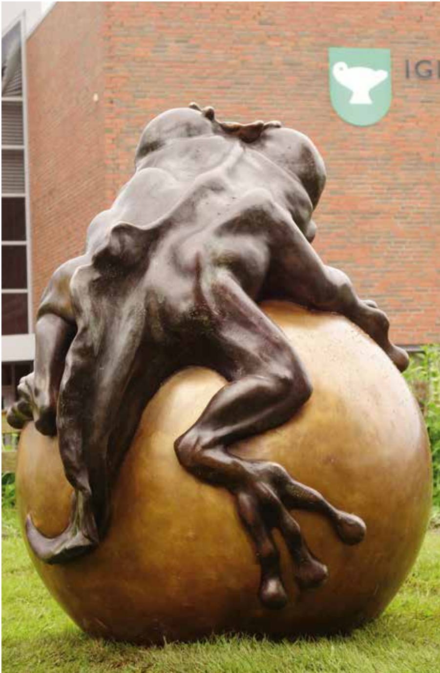
Iglemyr skole, Floskekongen – vil du holda me meg? (2016), © Laila Kongevold / BONO 2017