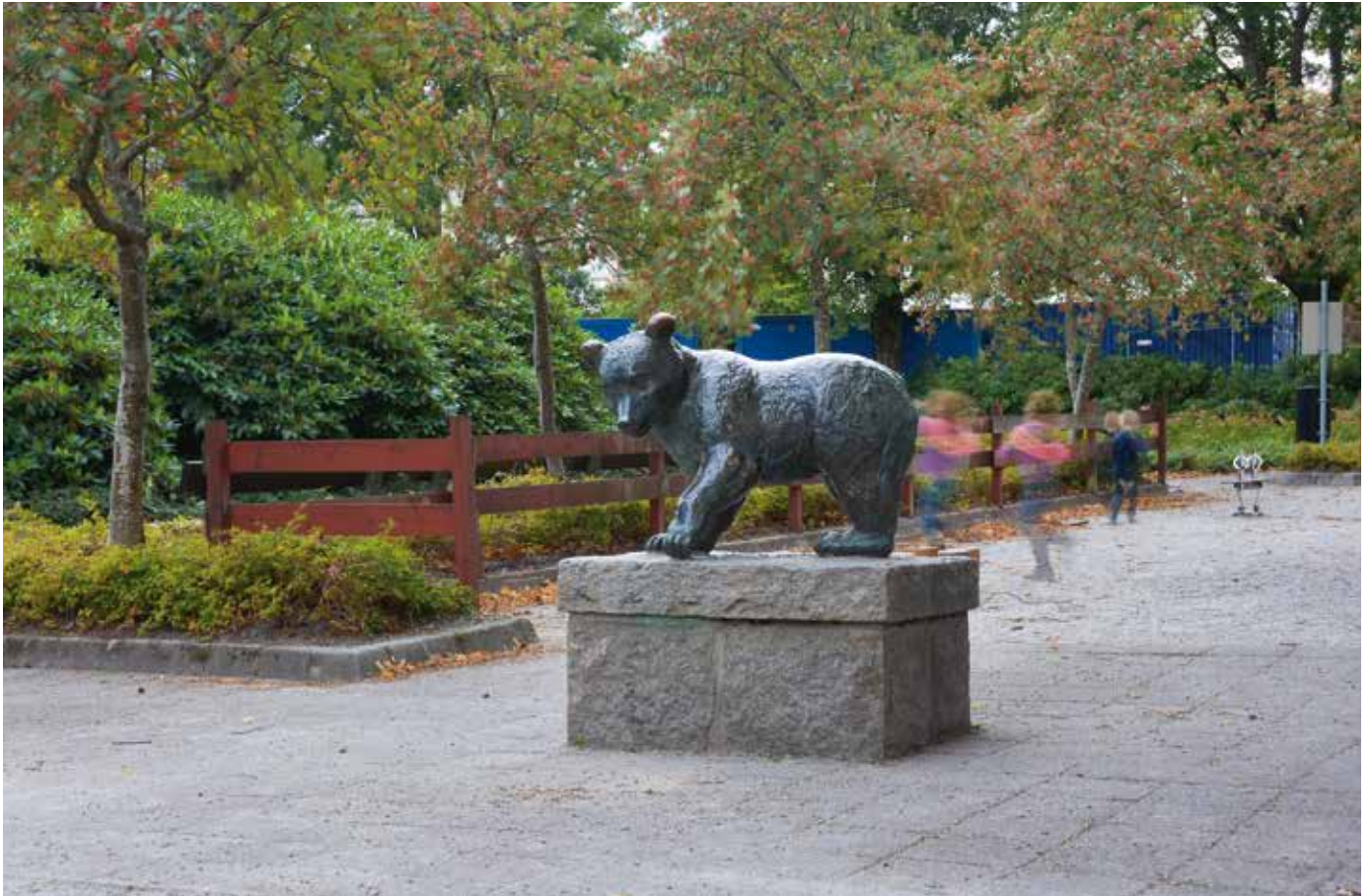
Øglændsparken, Bamse (1954), © Stinius Fredriksen / BONO 2017