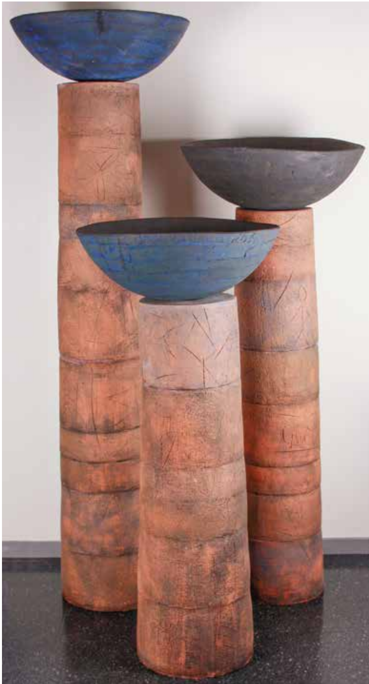
Kulturavdelingen, Keramikkfat på søyler, © Eli Glader/Bono 2017